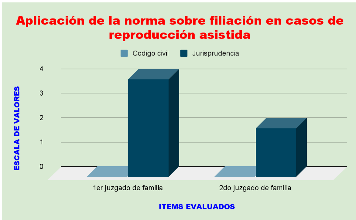
Figura 03: Aplicación de la norma sobre filiación en casos de reproducción asistida por parte de los magistrados.