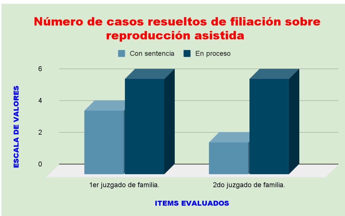
Figura 02: Número de casos resueltos de filiación sobre reproducción asistida.